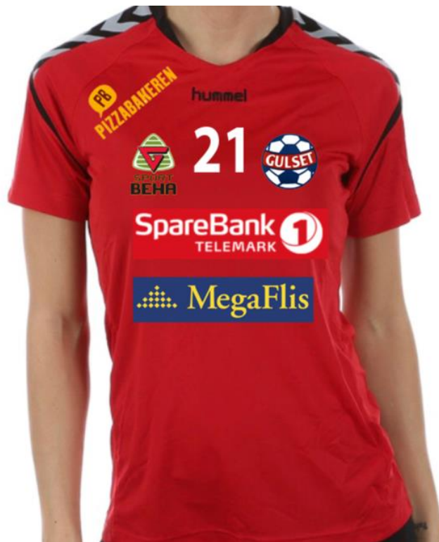
Figur 1 - Gulset IF Håndball spillerdrakt - Front