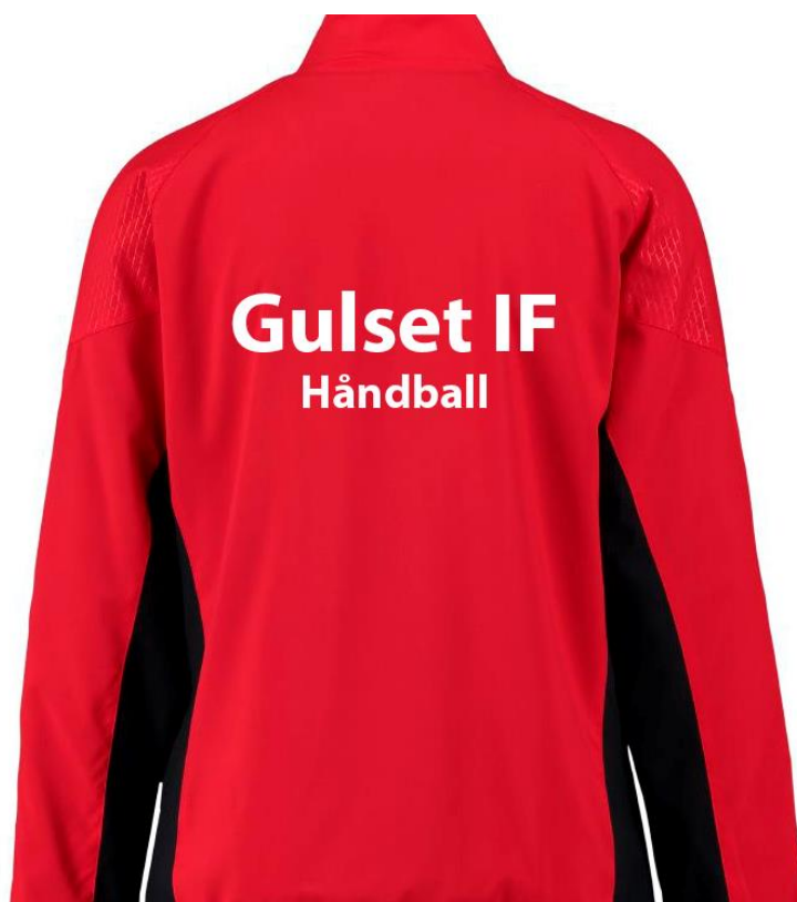
Figur 4 - Gulset IF Håndball overtrekkdrakt – Bak