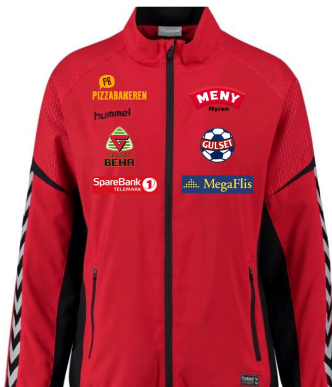
Figur 3 - Gulset IF Håndball overtrekkdrakt – Front