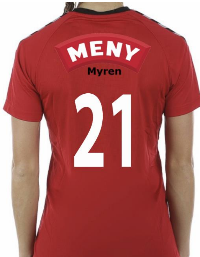
Figur 2 - Gulset IF Håndball spillerdrakt – Bak